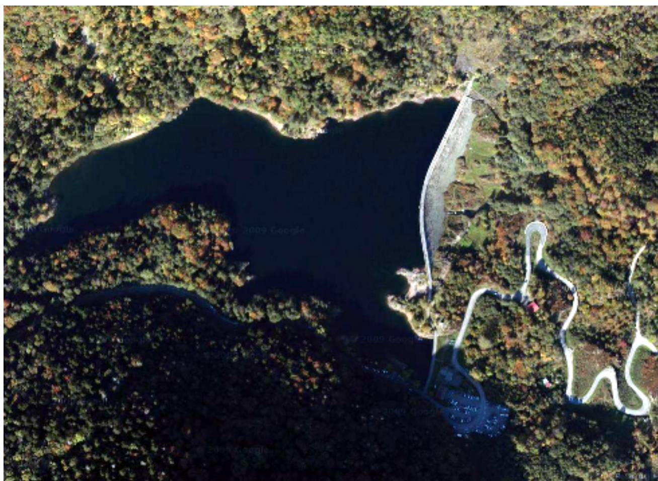
Le lac d'Alfeld, la digue et les lacets de la route