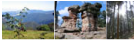
paysages, rochers, forêts