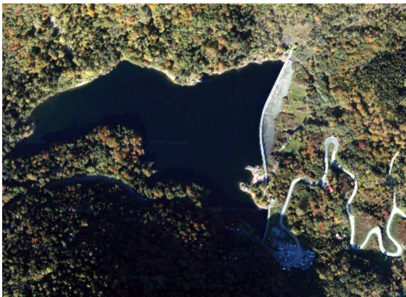
Le lac d'Alfeld, la digue et les lacets de la route