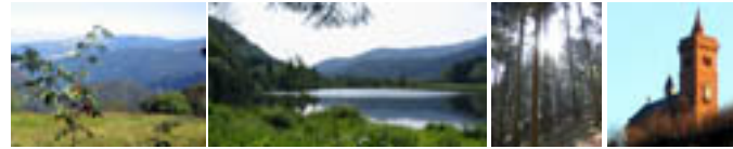
paysages, cascades, forêts, églises, villages